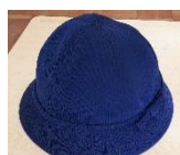
1・2年生用黄帽 3～6年生用紺帽